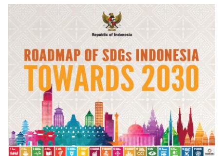
インドネシアSDGs行動計画（左）とSDGsロードマップ（右）